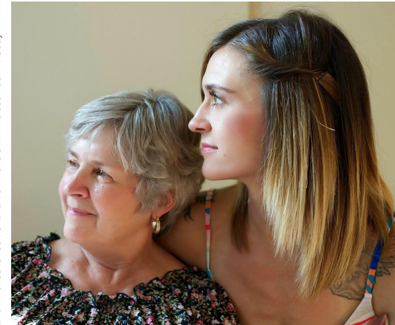
Bild Innenseite Mitte: Bild von ArtPhoto_studio auf Freepik Bild Innenseite rechts: Bild von Konstantin Kolosov auf Pixabay

Sprechstunde für Zellveränderungen an Muttermund und Genitalbereich